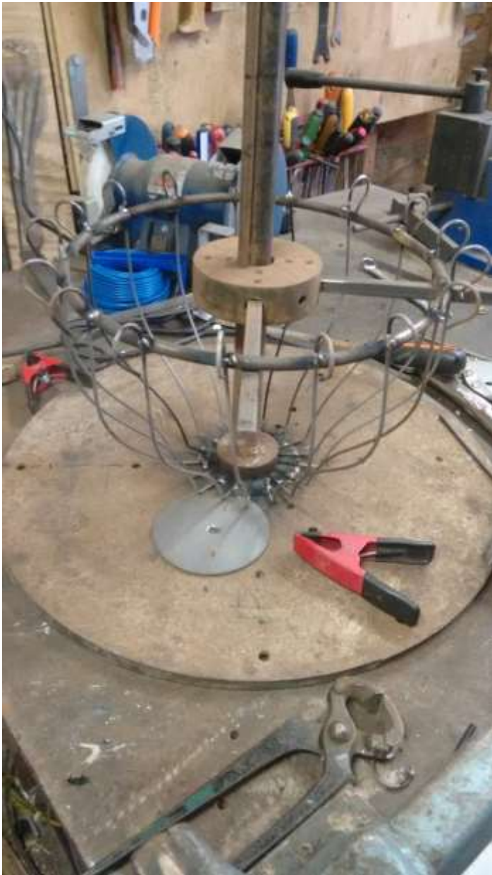
Frame voor bloemenhanger met oude fietsbanden .