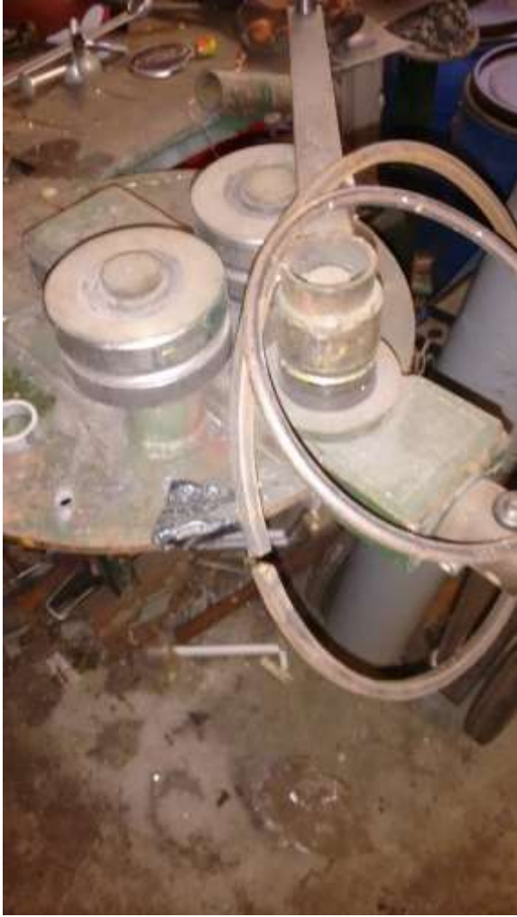
Handwals en ringen.