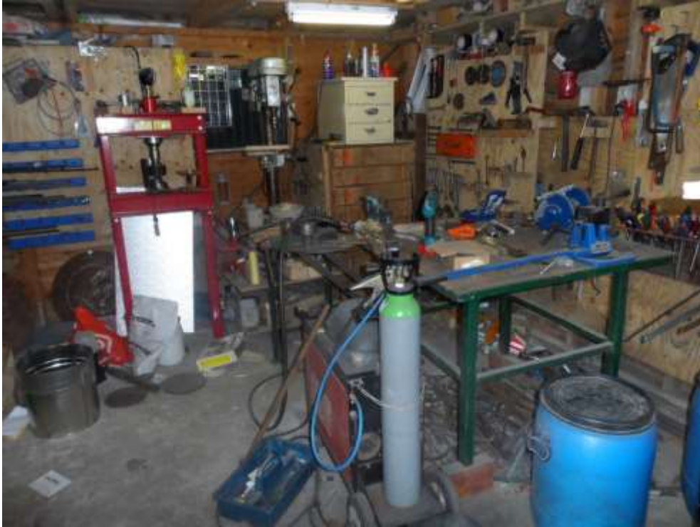
Metaal. CO2 Apparaat, kolomboormachine , Pers en veel handgereedschap .