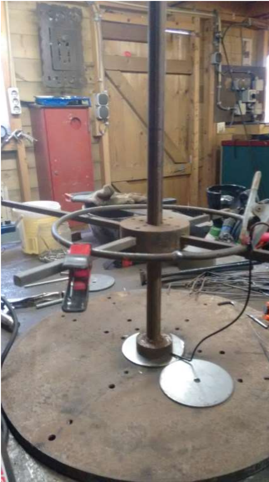
Hulpgereedschap voor het goed recht evenwijdig van stangen en ringen voor het vervaardigen van de frame van bloemenhanger .