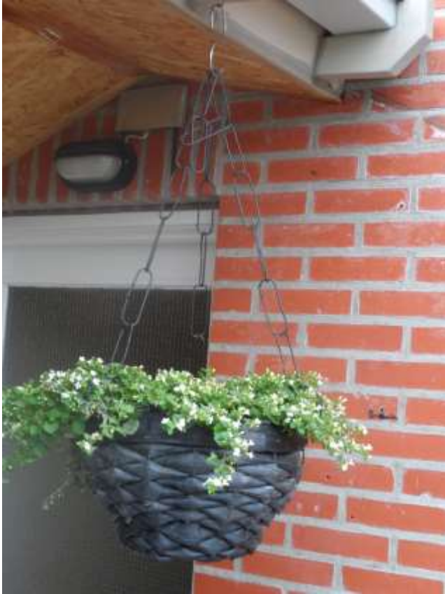
Bloemenhanger van oude fietsbanden .